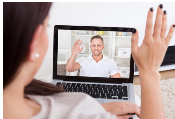
Exámenes orales, resolución de casos problema, estudio de caso