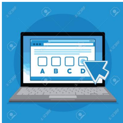
Exámenes tipo test o pregunta corta