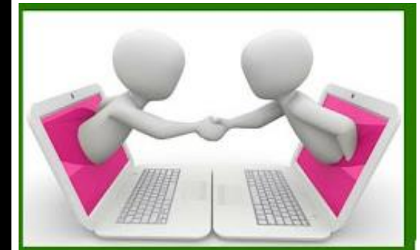
elaboración de trabajos, proyectos y portafolios